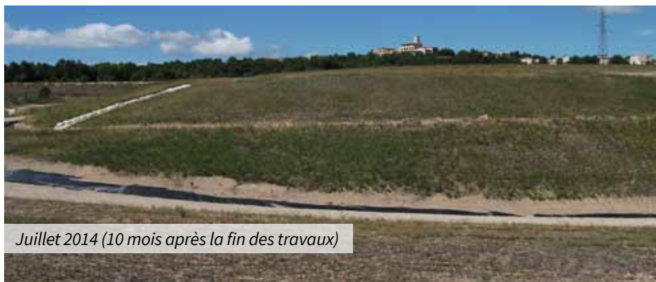
Juillet 2014 (10 mois après la fin des travaux)