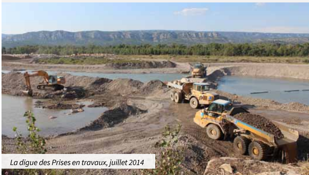
La digue des Prises en travaux, juillet 2014

Reconnaissance du SMAVD comme Établissement Public Territorial du Bassin de la Durance, par arrêté du Préfet coordonateur de Bassin du 26 mars 2010. Cette reconnaissance officielle du SMAVD comme EPTB de la Durance fait du SMAVD le porteur d'une approche globale des problématiques de la Durance à l'échelle de tout le bassin versant.