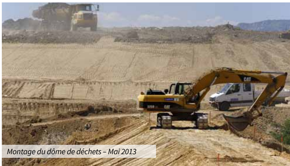
Montage du dôme de déchets – Mai 2013

L'ensemble des déchets a été rassemblé sous la forme d'un massif en forme de dôme afin d'éviter que les eaux de pluie ne s'infiltrent au cœur de la décharge réhabilitée. Les eaux de pluie sont aujourd'hui collectées jusqu'à des bassins de récupération. Le massif de déchets a été recouvert de plusieurs couches de matériaux spécifiques d'une épaisseur totale d'un mètre, puis il a été ensemencé. Les biogaz émis en très faible quantité par la fermentation des déchets sont oxydés par une couche de compost afin d'éviter tout impact sur la qualité de l'air. À présent et pendant 30 ans, le site doit être entretenu et surveillé. Des analyses sont réalisées au niveau des eaux des bassins, des eaux souterraines et des émissions de gaz.