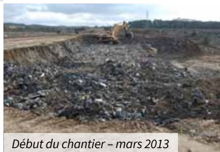
Début du chantier – mars 2013

Service Urbanisme Mairie de Mallemort 04 90 59 11 05